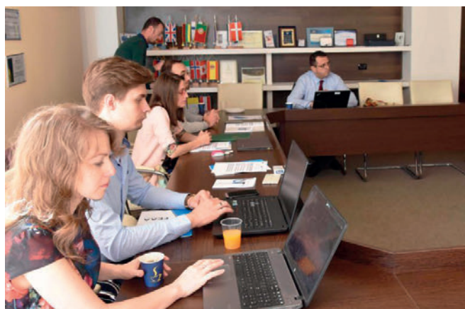
Projekta dalībnieku septiņā tikšanās Rumānijā.

atjautību, izdomu un zināšanām, taču katrai no tām pamatā ir teorija, kas studentam ir jāapgūst.