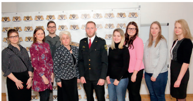
Iepazīstamies ar Valsts policijas darbu 2.02.2018.