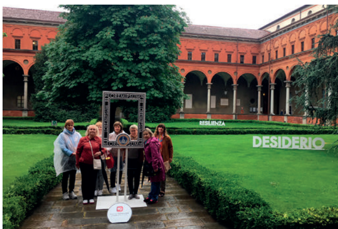
Koledžas filiāļu vadītājas, docētāji un darbinieki vizītē Katoļu Universitātē. 2018. gada 3. maijs, Milāna.

Universitātē ir 12 fakultātes, kurās kopumā tiek īstenotas 47 bakalaura studiju programmas, 31 maģistra studiju programma, kā arī vairākas profesionālā maģistra studiju programmas, īsā cikla studiju programmas, doktorantūras studijas. Katoļu Universitāte piedāvā dažāda veida studiju