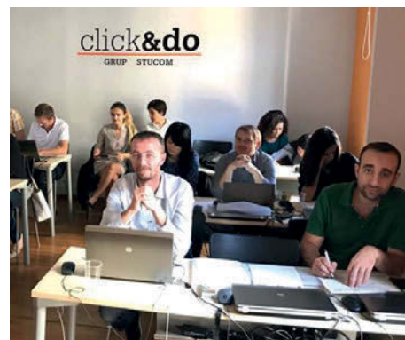
Ceturta tikšanās Barselonā (Spānija)

Ceturta tikšanās "TrustvGLP" projekta dalībniekiem bija Barselonā (Spānijā) no 28. septembra līdz 1. oktobrim. Bez paveiktajiem dalībnieku mājas darbiem tika prezentēta arī pilnveidotā spēle, kuras sākumu jau varēja izspēlēt. Spēlētājs ir ievietots virtuālā pilsētiņā, kurā attīsta grāmatvedības prasmes pie