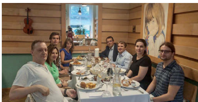
Pusdienu pauze trešajā tikšanās reizē Žešuovā (Polija)

Latvijā šīs tikšanās laikā kolēģus cienājām ar latviskiem ēdieniem un dzērieniem, bet kultūras programmas ietvaros piedāvājām viesoties vienā no Latvijas skaistākajām pilīm un aizvedām viņus uz Rundāli. Ciemiņi bija sajūsmā par ekskursiju, jo tās laikā izstaigājām gida pavadībā gan pils iekštelpas, gan arī paguvām izjust pils dārza svētku gaisotni.