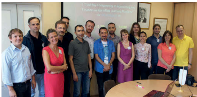
Projekta dalībnieku otrā tikšanās Rīgā (Latvija)

Projekta mērķis – izveidot grāmatvedības spēles datorplatformu, lai interaktīvā veidā sagatavotu grāmatvežus un finansistus darba tirgum, interesantā veidā sniegt zināšanas par grāmatvedību un finansēm ar spēļu, uzdevumu un testu palīdzību