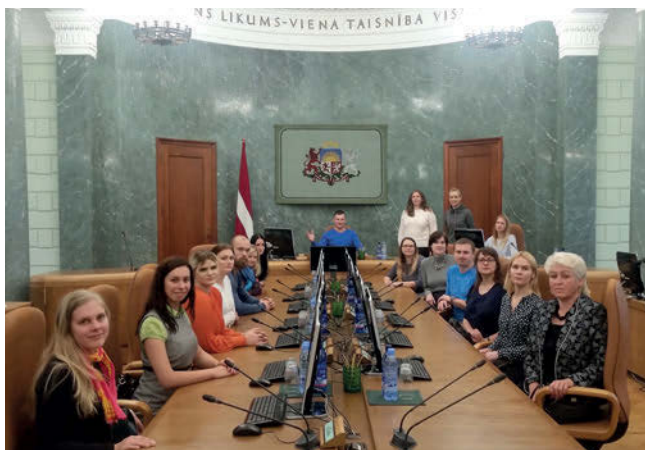
JK studenti Ministru kabineta sēžu zālē.