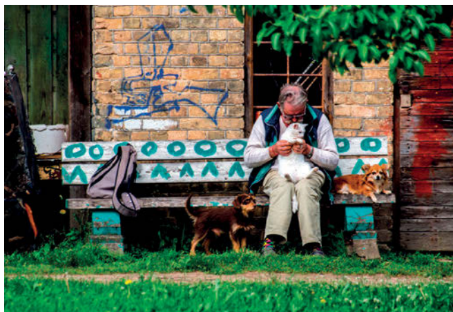
"Draudzība" (Talsi, 2017. gada jūnijs).