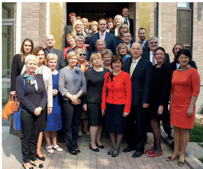
LKA biedri kopā ar Latvijas Republikas vēstnieku ĶTR Māri Selgu un vēstniecības darbiniekiem (2017. gada 29. marts)

Asociācijas biedri bija vizītē arī Latvijas vēstniecībā Ķīnā, kur tikās ar vēstniecības darbiniekiem un lietišķā sarunā apmainījās domām par sadarbības izveidi izglītības jomā un tās tālāku attīstību. Ņemot vērā Izglītības un zinātnes