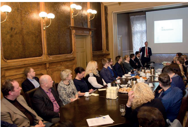
LRTK jaunu biedru uzņemšana (17.03.2017.)