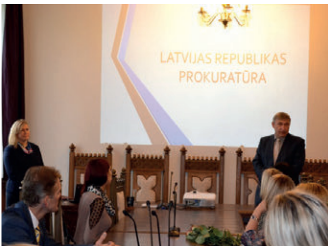
Tikšanās ar Latvijas Republikas ģenerālprokuru Ēriku Kalnmeieru

Juridiskās koledžas studenti šogad uz Ģenerālprokuratūru devās 4. oktobrī. Divu stundu ilgās vizītes laikā iepazināmies ar prokuratūru un tās darbu, tikāmies ar Latvijas Republikas ģenerālprokuru Ēriku Kalnmeieru, runājām par nozares aktuālajiem jautājumiem.