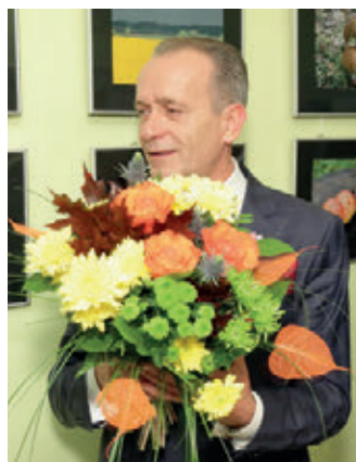
Latvijas Republikas tieslietu ministra Dzintara Rasnača personālās fotoizstādes atklāšana Juridiskajā koledžā 2016. gada 19. oktobrī