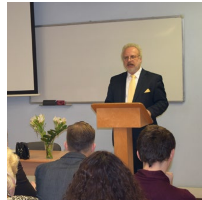
Eiropas Tiesas tiesneša Egila Levīta lekcija „Eiropas Savienība un Satversme” (4.11.2015.)