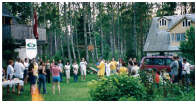
Studentu pašpārvaldes organizētais studiju gada noslēguma pasākums Mērsragā 2001. gada 7.-8. jūlijā.

1. izlaiduma absolvents, Studentu pašpārvaldes (2000/2002) priekšsēdētājs