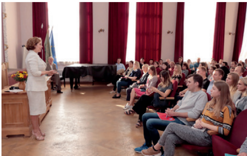
Lekcija Juridiskās koledžas pirmā kursa studentiem "Latvijas ekonomikas un politikas izaicinājumi tagad un tuvākajā nākotnē" 2020. gada 26. septembrī. Vieslektore – Saeimas deputāte, bijusī Latvijas finanšu ministre un ekonomikas ministre Dana Reizniece-Ozola.

Kurā brīdī Jūsu dzīvē sākās aizrašanās ar kosmosa izpēti, satelīttehnoloģijām, to pielietojumu?