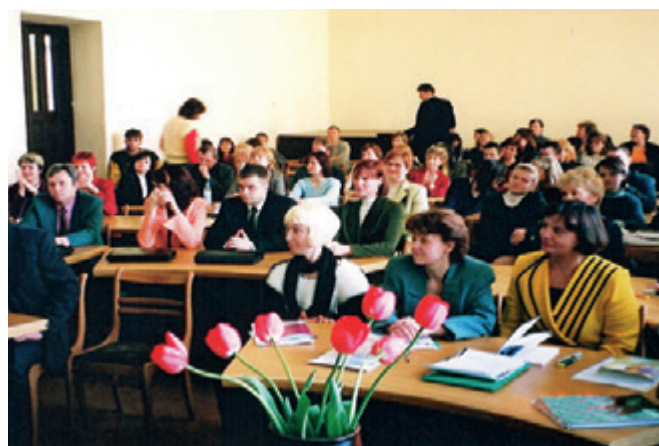
Studenti Ventspils filiālē (20.04.2001.)

2000. gada 1. decembris – pirmā mācību diena, kad studijas Rīgā uzsāk 460 studenti. Pirmās lekcijas: “Ievads