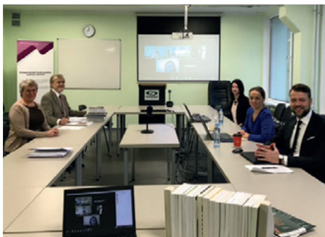
Studiju virziena "Ekonomika" akreditācija (Rīga, 14.10.2020.).

Starptautiskā akreditācijas komisija 14.–16. oktobrī Juridiskajā koledžā studiju virziena izvērtēšanu veica gan Rīgā, gan arī Gulbenes un Valmieras filiālēs.